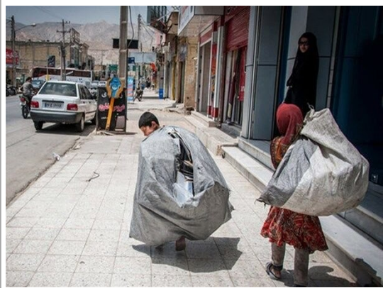
از مدیای اجتماعی

نه به حکومت مافوق مردم، آری به حکومت شورائی!