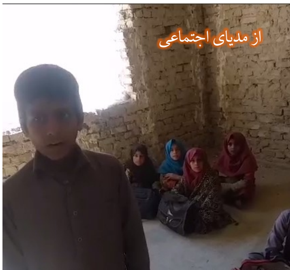
از مدیای اجتماعی