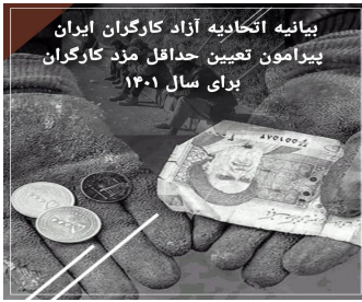
بیانیه اتحادیه آزاد کارگران ایران پیرامون تعیین حداقل مزد کارگران برای سال ۱۴۰۱

شرق کشور دست در دست هم بگذاریم و با اعتراضات قدرتمند و سراسری خواهان دگرگون شدن بنیادین قوانین و سیاست‌های ناظر بر زندگی و هستی مان شویم.