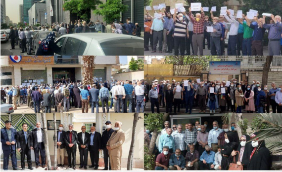
تجمع بازنشستگان صنعت نفت در شهرهای شیراز، اراک، اهواز، تهران، کرج، اصفهان، آبادان و اردبیل