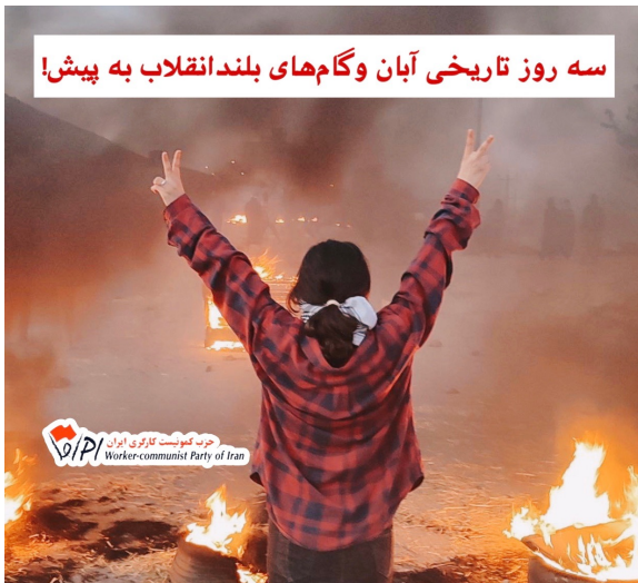
سه روز تاریخی آبان و گام‌های بلند انقلاب به پیش!

پیشروی ها و دستاوردهای انقلاب زن، زندگی، آزادی را گرامی میدارد و خود را در شکل دادن به آن سهم و دخیل میداند. ما دست تک تک فعالان و سازندگان این انقلاب شورانگیز را به گرمی میفشاریم و دوشادوش آنان میکوشیم تا روزها و هفته های آتی را به صحنه به میدان آمدن میلیونها کارگر و معلم و دانشجو و دانش آموز و کارمند و کشاورز و راننده و بازاری و دیگر اقشار جامعه در اشکال مختلف و اعتصاب و تظاهرات و تسخیر محلات و شهرها و مراکز دولتی و سرانجام قیام نهایی علیه جمهوری اسلامی تبدیل کنیم.