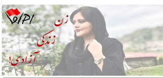
حکومت اسلامی نابود باید گردد!