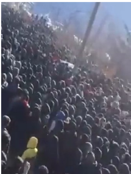
نمیخوایم، نمیخوایم". زنده باد انقلاب زن حزب کمونیست کارگری ایران ۹ دی ۱۴۰۱، ۳۰ دسامبر ۲۰۲۲ زندگی آزادی! نابود باد حکومت اسلامی!