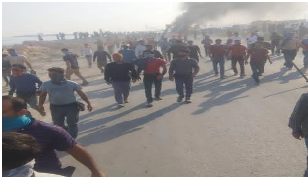
از صفحه ۷