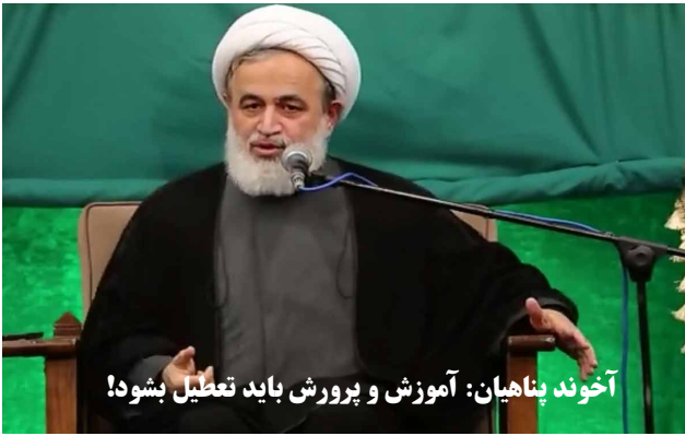
آخوند پناهیان: آموزش و پرورش باید تعطیل بشود!

برای این حکومت همچنانکه زندگی مردم و حتی موجودیتشان به عنوان انسانهایی که باید زندگی کنند و از زندگی لذت ببرند، کمترین اهمیتی ندارد، کودکان به طریق اولی بی اهمیت است. کودکان برای جمهوری اسلامی تا آنجا اهمیت دارد که بتوانند آنها را