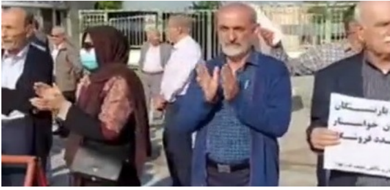
حزب کمونیست کارگری ایران ۲۳ آذر ۱۴۰۲، ۱۴ دسامبر ۲۰۲۳

روز گذشته بیست و دوم آذر ماه این بازنشستگان نفت در مقابل صندوق بازنشستگی این صنعت در اهواز تجمع کردند و بار دیگر اعتراض خود را به اساسنامه هیات دولت برای صندوق های بازنشستگی و دست درازی به صندوق بازنشستگی نفت اعلام کرده و خواستار لغو فوری این مصوبه شدند. در این تجمع اعتراضی کارگران رسمی نیز همراه بودند. تجمع کنندگان شعار میدادند: "امداد، امداد! از این همه بیداد!"