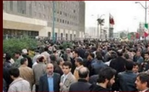
کمیته سازمانده حزب کمونیست کارگری ایران

این شعارها را در همه جا میشود بازتکثیر کرد.