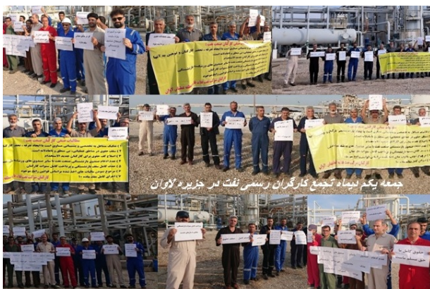
جمعه یکم دیماه تجمع کارگران رسمی نفت در جزیره لاوان

حزب کمونیست کارگری ایران ۱ دی ۱۴۰۲، ۲۲ دسامبر ۲۰۲۳