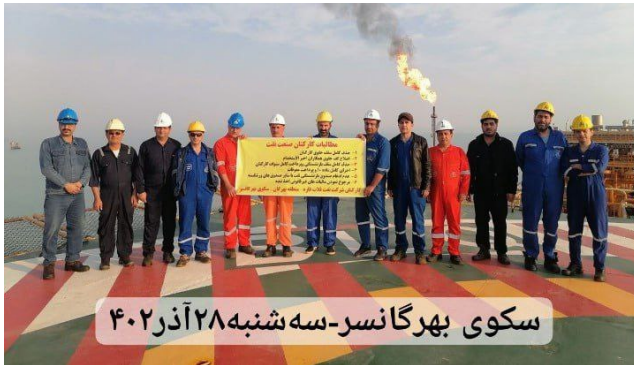
سکوی بهرگانسر - سه شنبه ۲۸ آذر ۴۰۲

حزب کمونیست کارگری ایران ۲۸ آذر ۱۴۰۲، ۱۹ دسامبر ۲۰۲۳