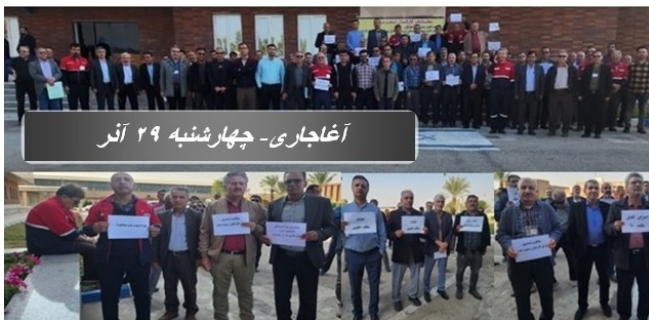
آغاچاری - چهارشنبه ۲۹ آذر

مهم اقتصادی جمهوری اسلامی وسیعا حمایت کنیم. حزب کمونیست کارگری ایران ۲۹ آذر ۱۴۰۲، ۲۰ دسامبر ۲۰۲۳