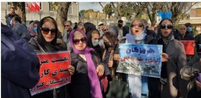
حزب کمونیست کارگری ایران ۴ دی ۱۴۰۲، ۲۵ دسامبر ۲۰۲۳

امروز دوشنبه ۴ دیماه بازنشستگان کشوری از جمله معلمان بازنشسته بنا بر فراخوان از قبل اعلام شده در مقابل سازمان برنامه و بودجه در تهران تجمع بزرگی برپا کردند و اعتراض متحدانه خود به کل اجحافات و تعرضات حکومت و مفتخوران حاکم را ابراز کردند. اعتراض بازنشستگان به فقر و بی‌تامینی و تعرضات معیشتی هر روزه حکومت از جمله برنامه کذایی توسعه هفتم و پاسخ نگرستن خواسته‌های اعلام شده شان و سرکوبگریهای حکومت است. فراخوان این اعتراض به همه بخش‌های معترض بازنشستگان بود و طبق معمول بازنشستگان تامین اجتماعی نیز حضور داشتند. در این تجمع اعتراضی بازنشستگان خشمگین شعار میدادند: "عزاست امروز، روز عزاست امروز، حقوق بازنشسته زیر عباس است امروز" و با این شعار بساط چپاول و غارتگری حکومت را به چالش کشیدند.