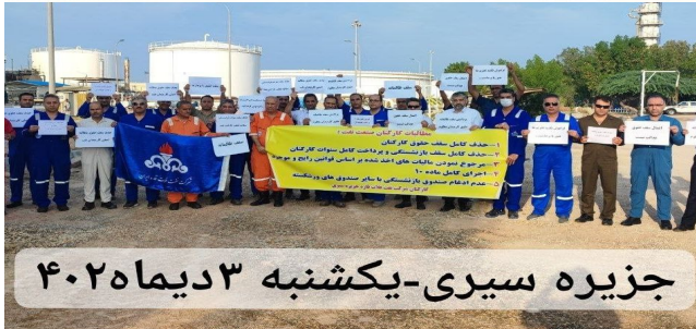
جزیره سیری - یکشنبه ۳ دیماه ۴۰۲۵

پیش از سه ماه از اعتراضات کارگران رسمی نفت بخاطر تعرضات معیشتی حکومت و بی پاسخ ماندن مطالباتشان میگذرد. روز چهارم دیماه کارگران شرکت بهره برداری نفت و گاز آغاچاری تجمع داشتند و روز قبل از آن کارگران شرکت فلات قاره دست به تجمع زدند.