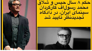
حکم ۸ سال حبس و شلاق محمد رسول اف کارگردان سینمای ایران، در دادگاه تجدیدنظر تایید شد

بیانیه حمایتی جمعی از معلمان کنشگر سراسر کشور در محکومیت حکم ناعادلانه محمد رسول اف کارگردان مستقل سینمای ایران