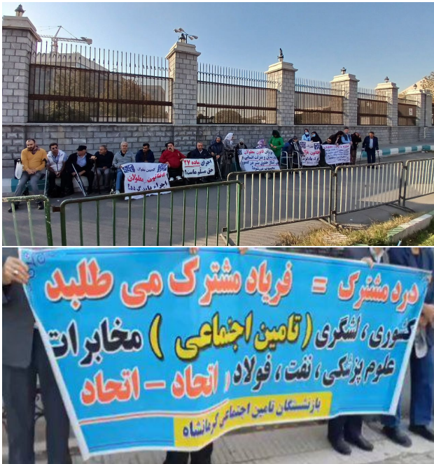
حزب کمونیست کارگری ایران ۲۹ آبان ۱۴۰۳، ۱۹ نوامبر ۲۰۲۴

روز سه شنبه ۲۹ آبان بازنشستگان کشوری که بخش مهمی از آنها معلمان هستند همراه با دیگر بازنشستگان برای پیگیری مطالبات خود مقابل صندوق بازنشستگی در کرمانشاه تجمع کردند.