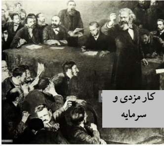
کارمزدی و سرمایه