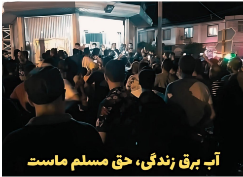
آب برق زندگی، حق مسلم ماست

بر جمهوری اسلامی "سر دادند. و در شیراز جوانان در محلاتی شعار میدادند: "مرگ بر دیکتاتور"، "مرگ بر جمهوری اسلامی".