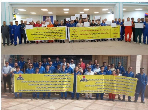
حزب کمونیست کارگری ایران ۷ آبان ۱۴۰۴ - ۲۹ اکتبر ۲۰۲۵

امروز هفتم آبانماه کارگران رسمی نفت در منطقه بهرگان از ساعت هفت از الی صبح دست به اعتصاب و تجمع زدند. کارگران رسمی اعلام کرده اند که تا رفع مشکلات خود به اعتراضاتشان ادامه خواهند داد.